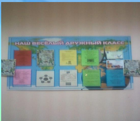
Стенд «К уроку»