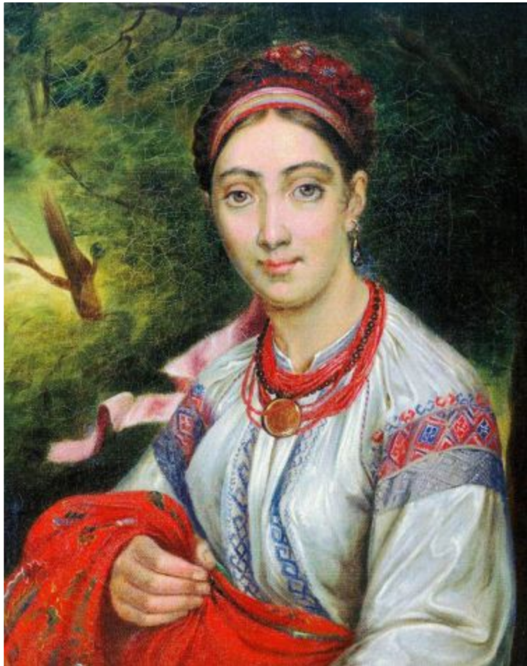
«Украинская девушка с Подолья»