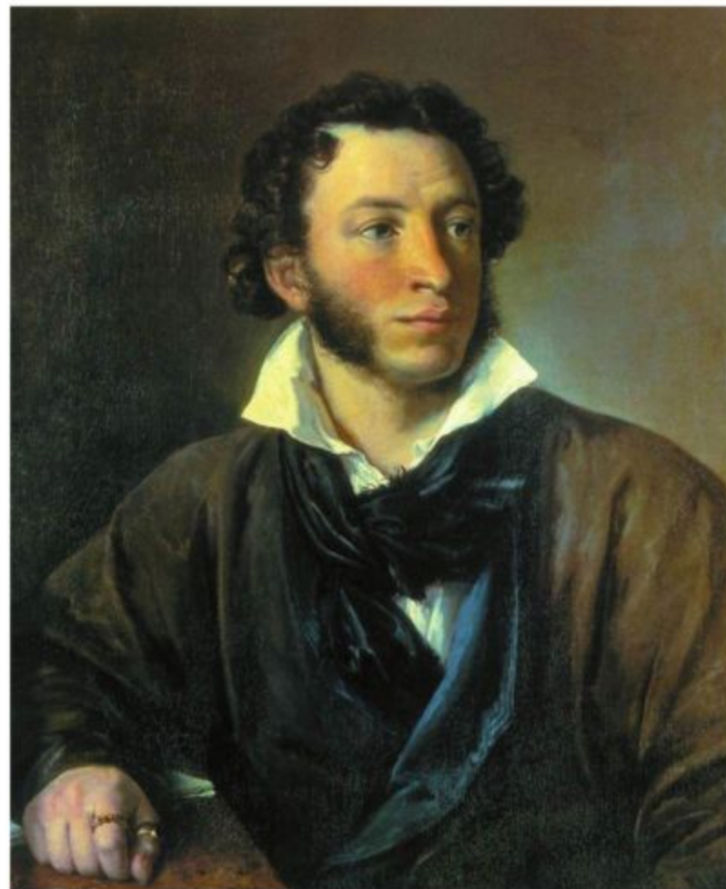
В. А. Тропинин Портрет А. С. Пушкина