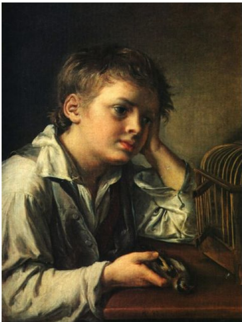
В. А. Тропинин «Мальчик, тоскующий об умершей своей птичке»