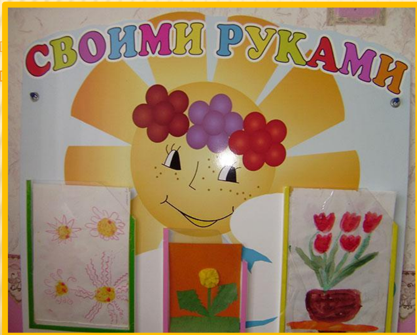
Подставка для поделок из пластилина.

В оформлении приёмной всегда найдётся место для работ детей, их творчества. Благодаря родителям были приобретены стенд «Своими руками» где размещаем рисунки, аппликации детей.