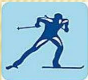
ЛЫЖНЫЕ ГОНКИ НА ДЛИННЫЕ ДИСТАНЦИИ