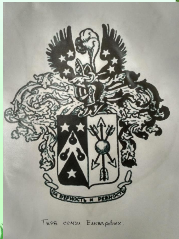
Герб семьи Елизаровых.