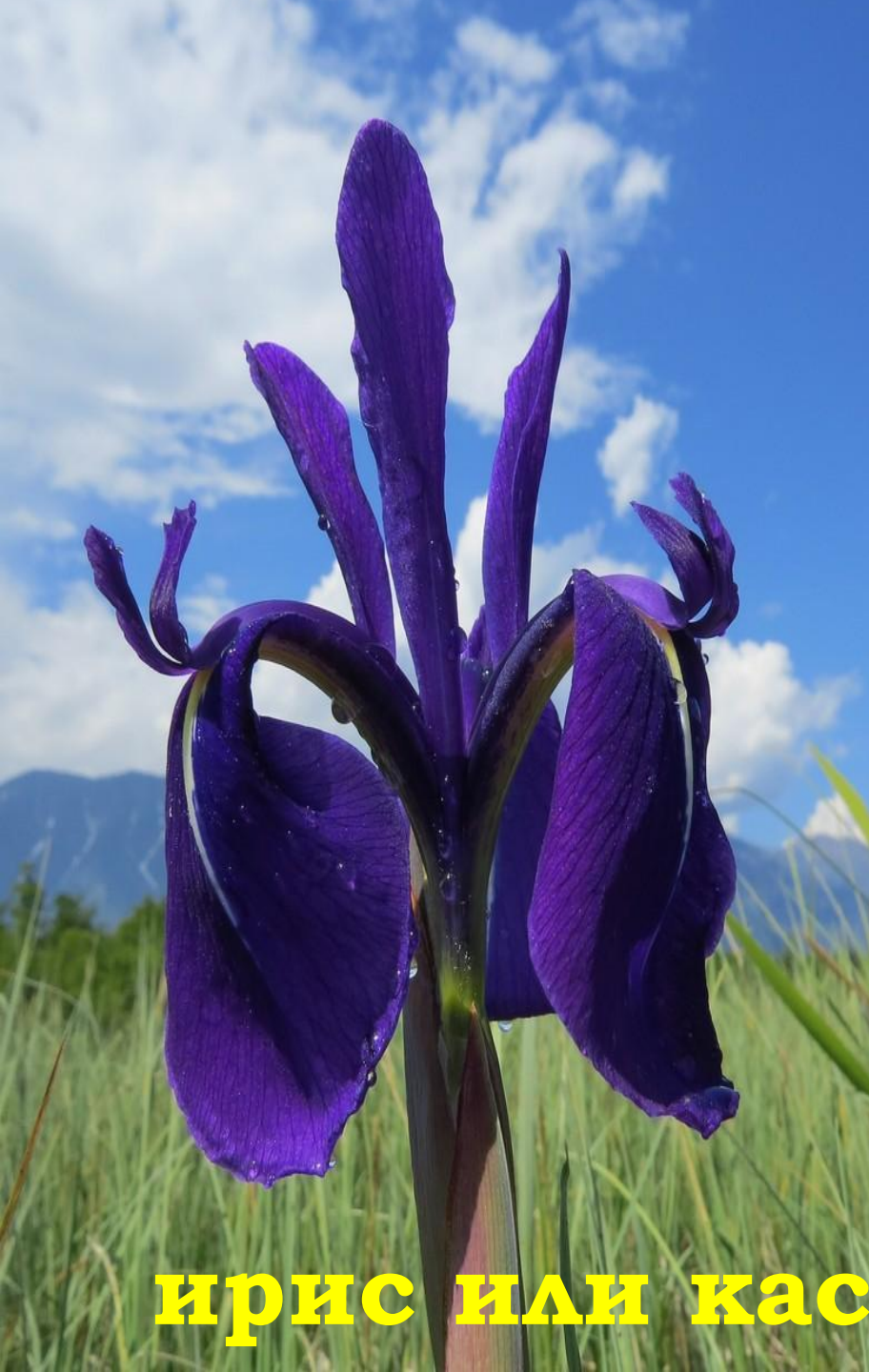
ирис или касатик гладкий