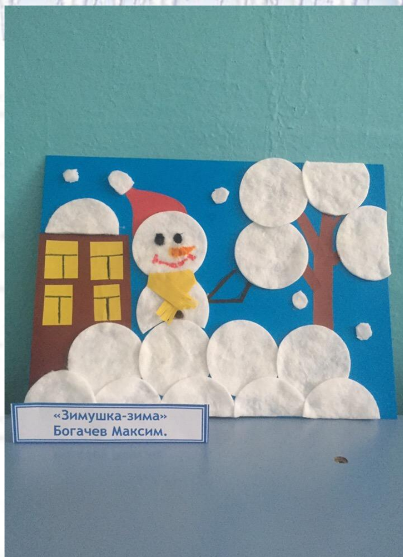
«Зимушка-зима» Богачев Максим.