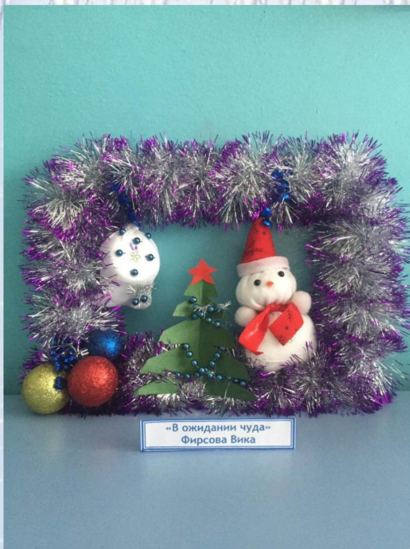
«В ожидании чуда» Фирсова Вика