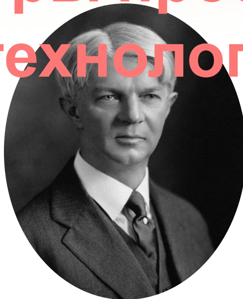
Уильям Херд Килпатрик (1871 – 1965)