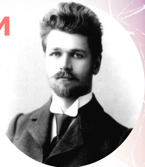
Станислав Теофилович Шацкий (1878—1934)

Метод проектов возник еще в начале 20 века в США. Его авторами являются американский философ и педагог Дж.Дьюи а также его ученик У.Х.Килпатрик.