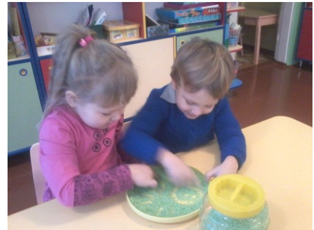
Рисование на крупе