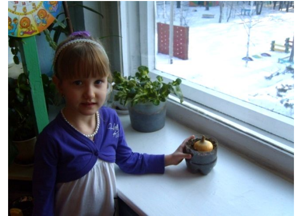
Игра «Полезь света»