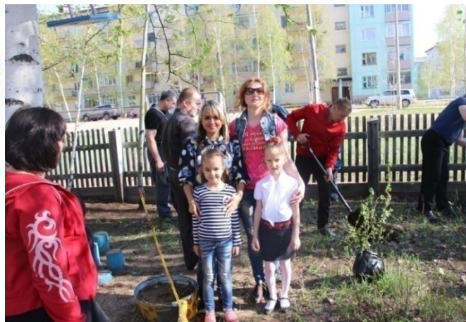
Совместный проект: «Благоустройство и озеленение участка»