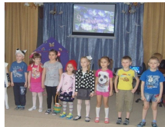
Занятие «В мире животных»