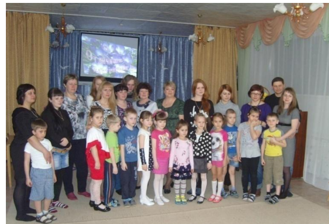
Собрание с детьми и родителями «Развитие познавательной активности»