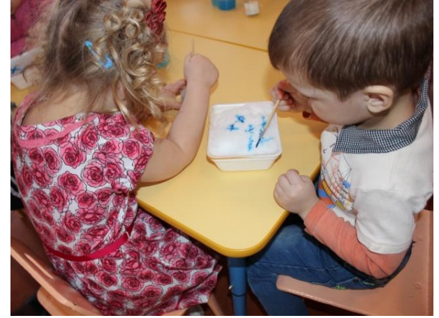
Рисование на снегу