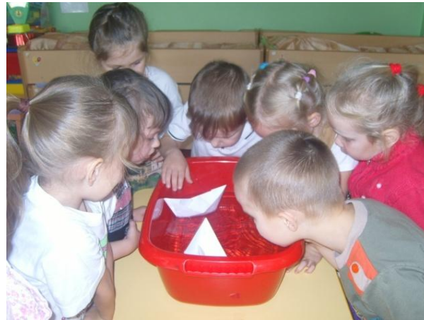
«Плыви, плыви кораблик»