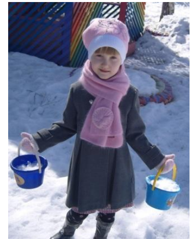
Эксперимент со снегом