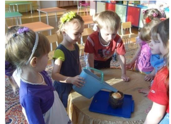
Проект «Юный эколог»