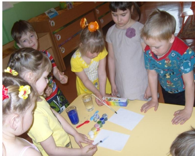
Опыт «Имеет ли вода цвет»