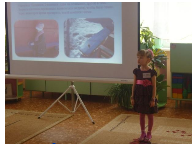
Форум детских проектов