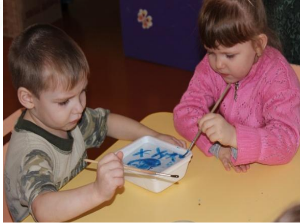
Рисование на льду