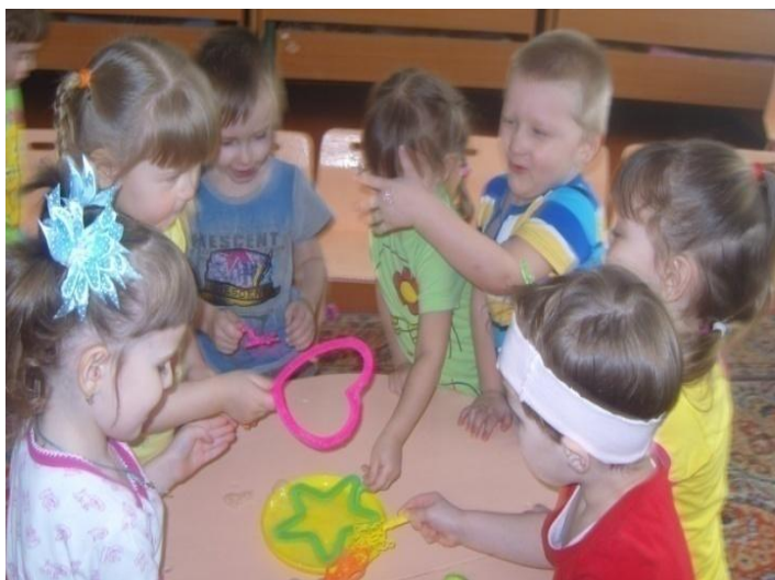
«История мыльных пузырей»