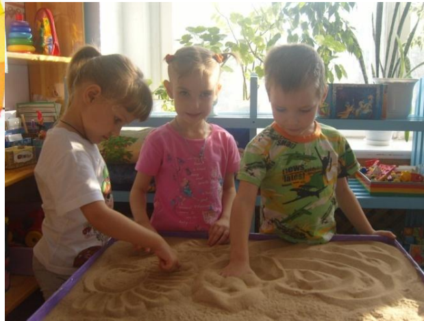
«Рисование на песке»