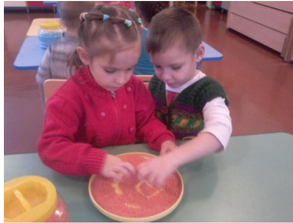
Рисование на соли