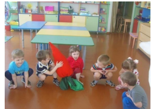
«Большие и маленькие»