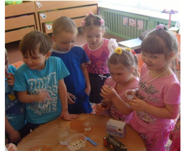
Опыт «Имеет ли вода вкус»