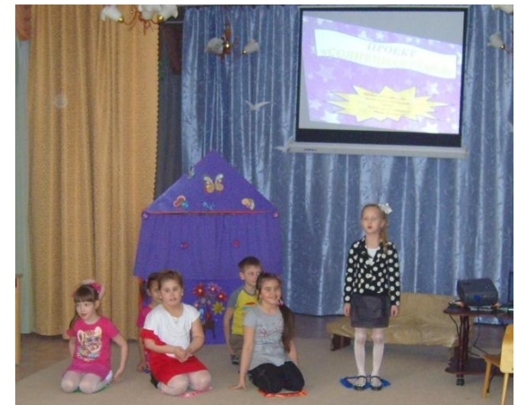
Проект «Есть ли у ёлочки семья»