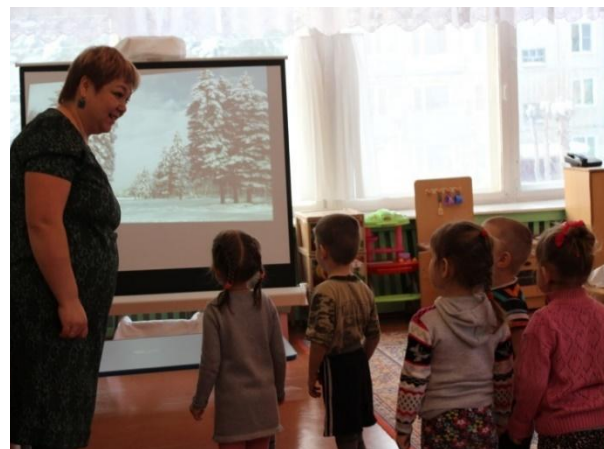
Занятие «Поможем белому медведю»