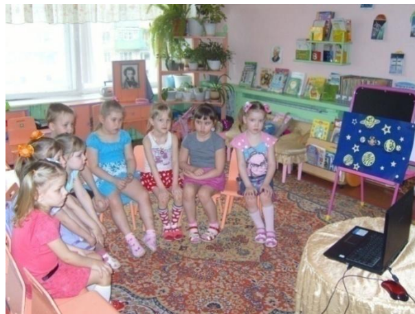
Занятие «Космическая семья»