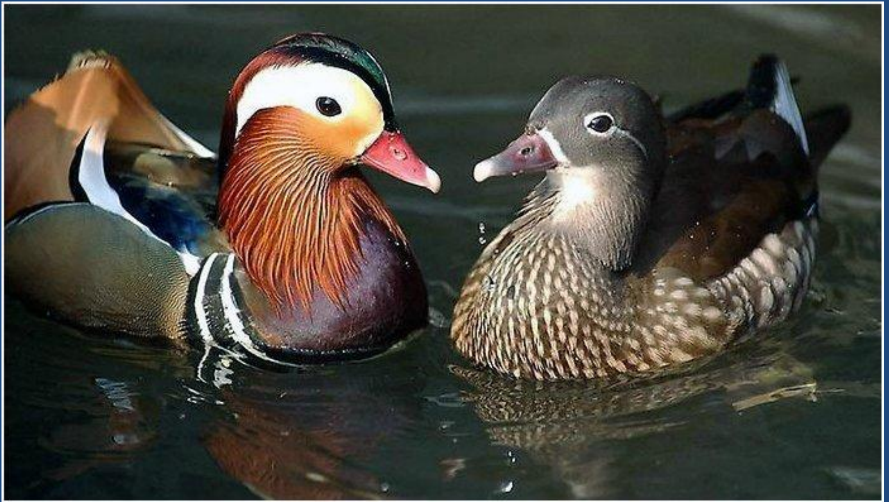
Утка - мандаринка