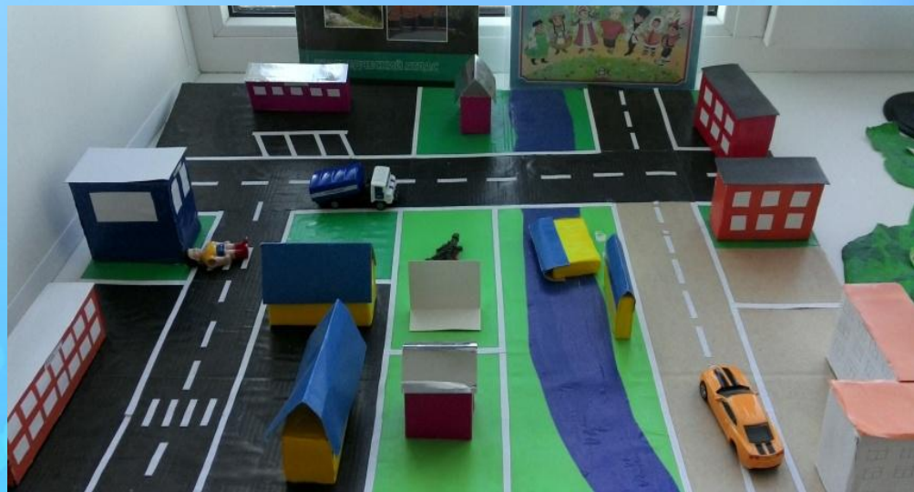
Коврик «Дорожное движение»