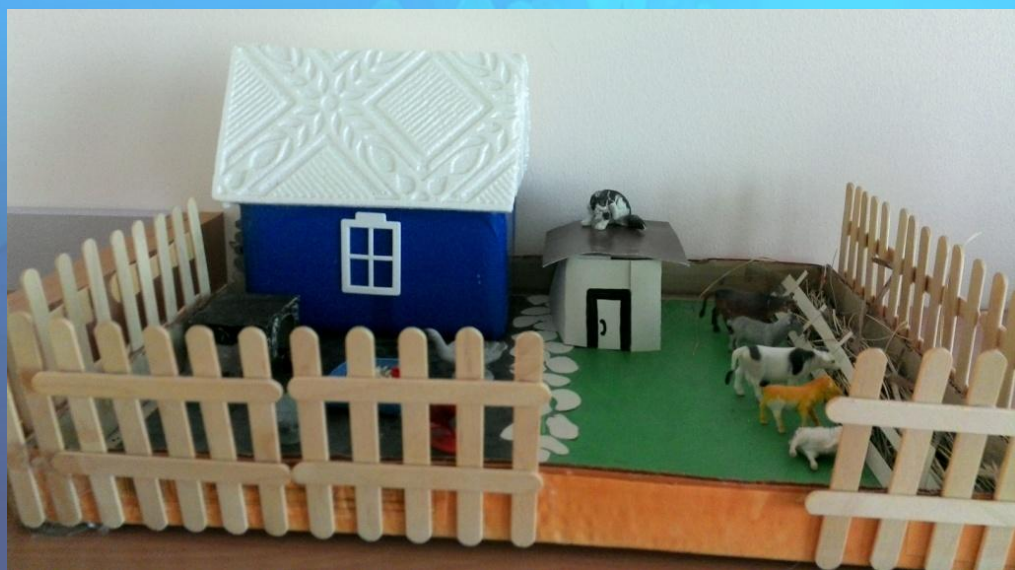
Макет «Домашние животные»