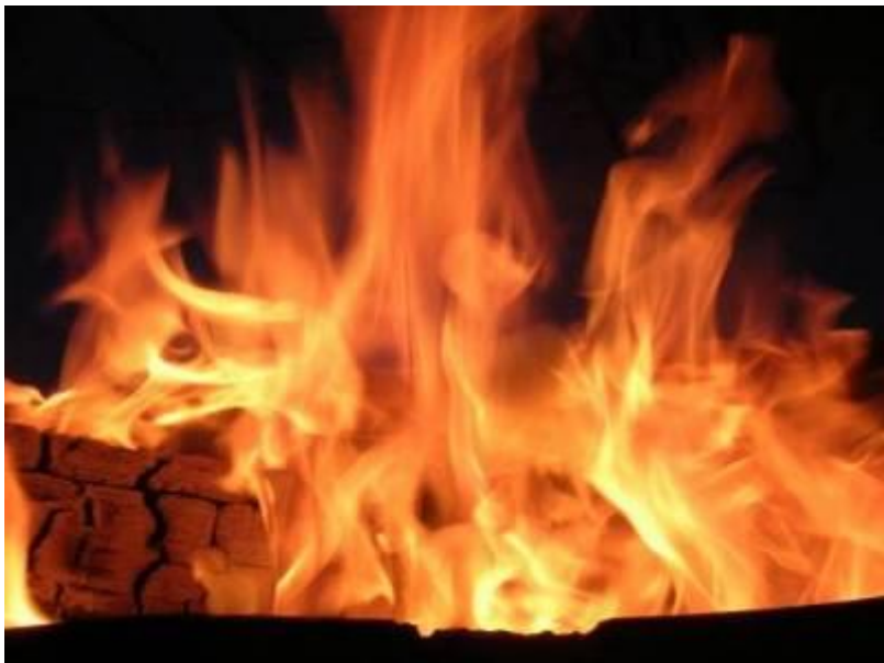
ПЫЛ (жар от огня)