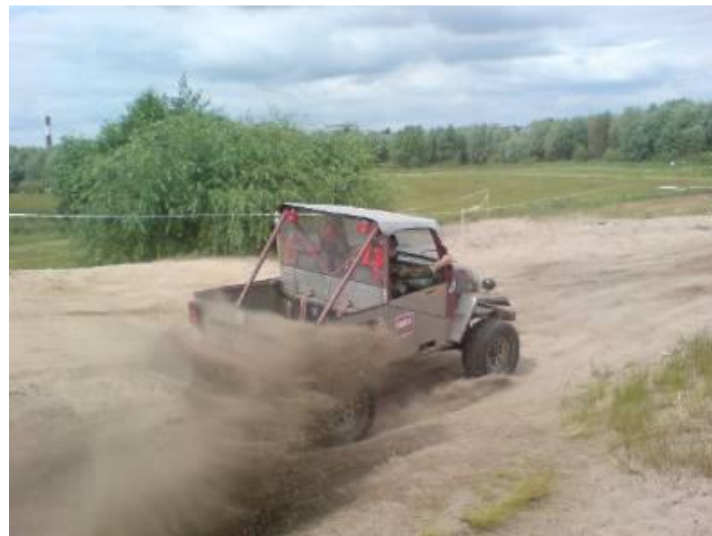
ПЫЛЬ (частицы в воздухе)