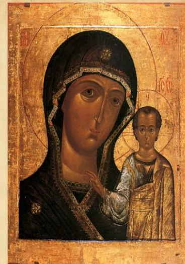
Казанская икона Божией Матери. 1579 год.

4 ноября — день Казанской иконы Божией Матери — с 2005 года отмечается как День народного единства.