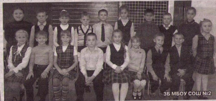
3Б МБОУ СОШ №2

Сейчас баба Нина на пенсии. Она работает на даче, сажает растения, ухаживает за ними. Без её стараний у нас бы не было ни овощей, ни ягод, ни душистых цветов. Дома она прибирается, моет посуду и готовит еду. После школы она встречается меня вкусным обедом. Иногда моя бабушка бывает строгой, но, если ругает, то справедливо, за дело. Моя бабушка очень работящая, добрая, заботливая, умная. Я отношусь к ней как к очень хорошему другу, к которому всегда можно обратиться.