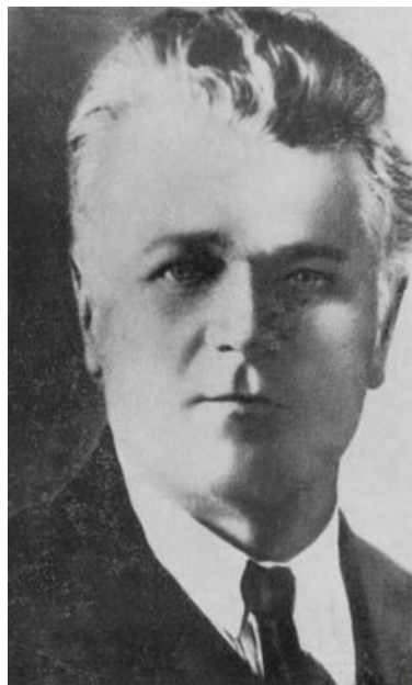
Станислав Тимофеевич Шацкий (1878 – 1934 гг.) советский педагог

На практике воплотил свою идею самоуправления школьников.