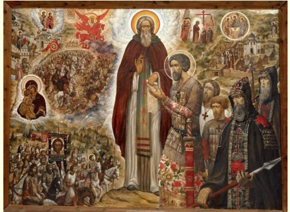
Дмитрий Донской и Сергий Радонежский