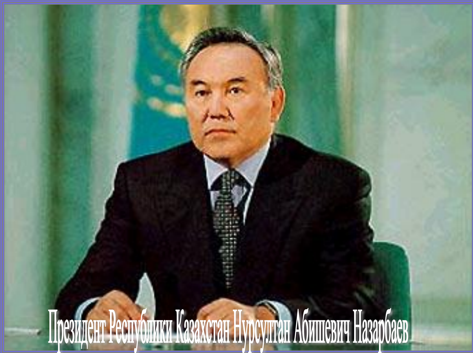
Президент Республики Казахстан Нурсултан Абишевич Назарбаев