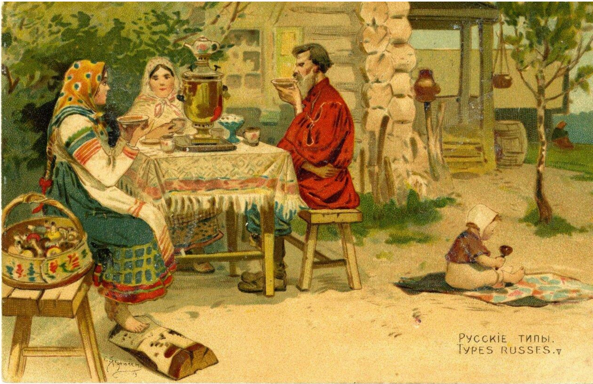
РУССКІЕ ТИПЫ. TYPES RUSSES. v