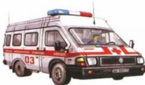
машина «Скорая помощь»