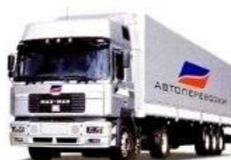
ТЯГАЧ С ПРИЦЕПОМ