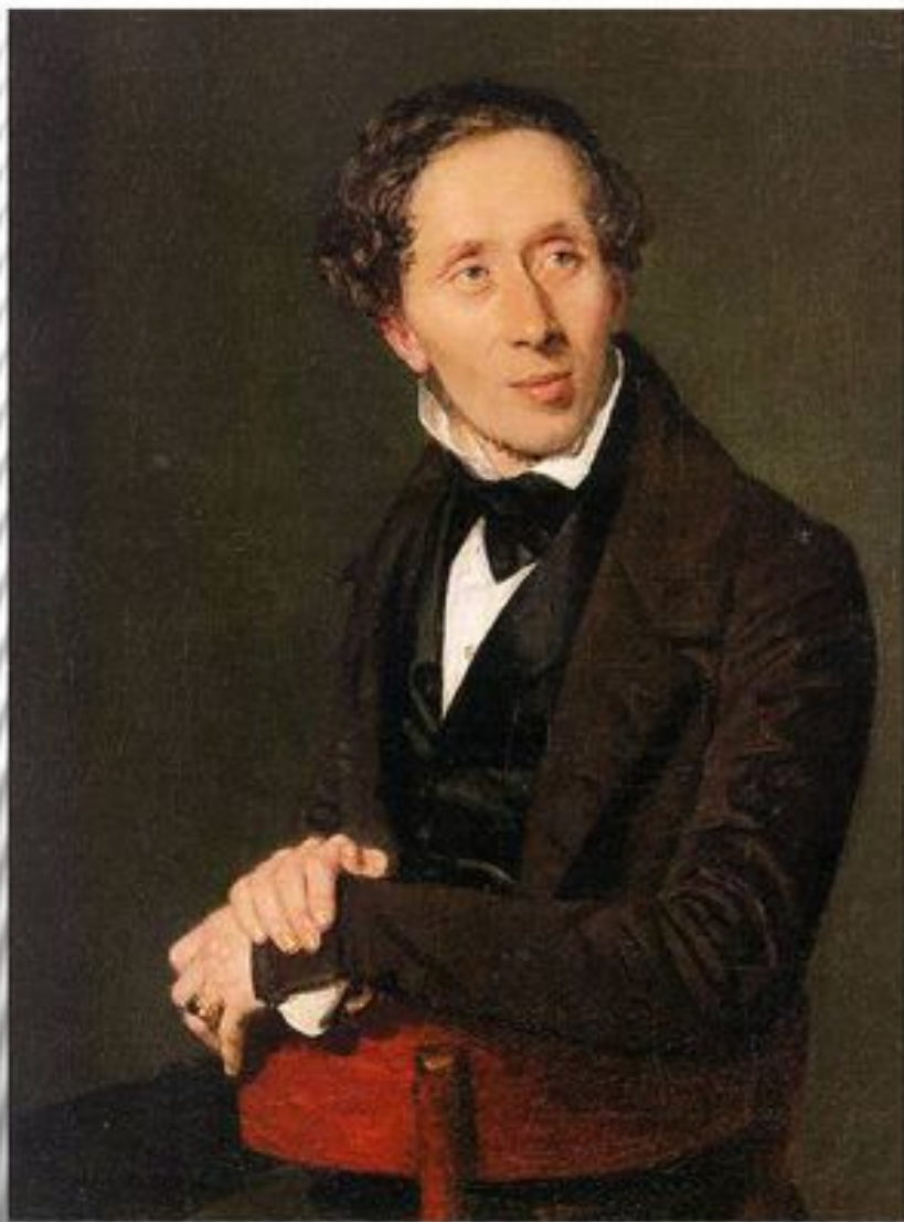
Ганс Христиан Андерсен (1805-1875)