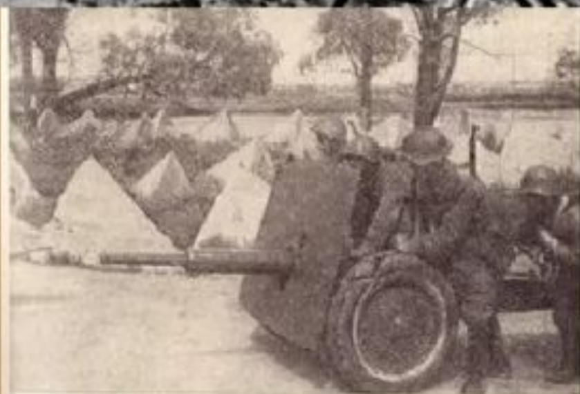
На ближних подступах к Ленинграду. Август 1941 г.

В сентябре бои уже шли на подступах к Ленинграду. Фашисты стремились взять город в кольцо, отрезать его от остальной территории СССР.