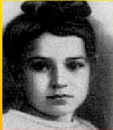
Жительница блокадного Ленинграда Таня Савичева