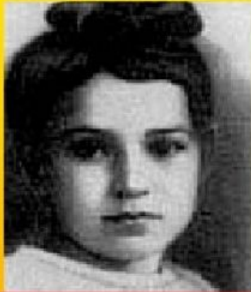
Жительница блокадного Ленинграда Таня Савичева