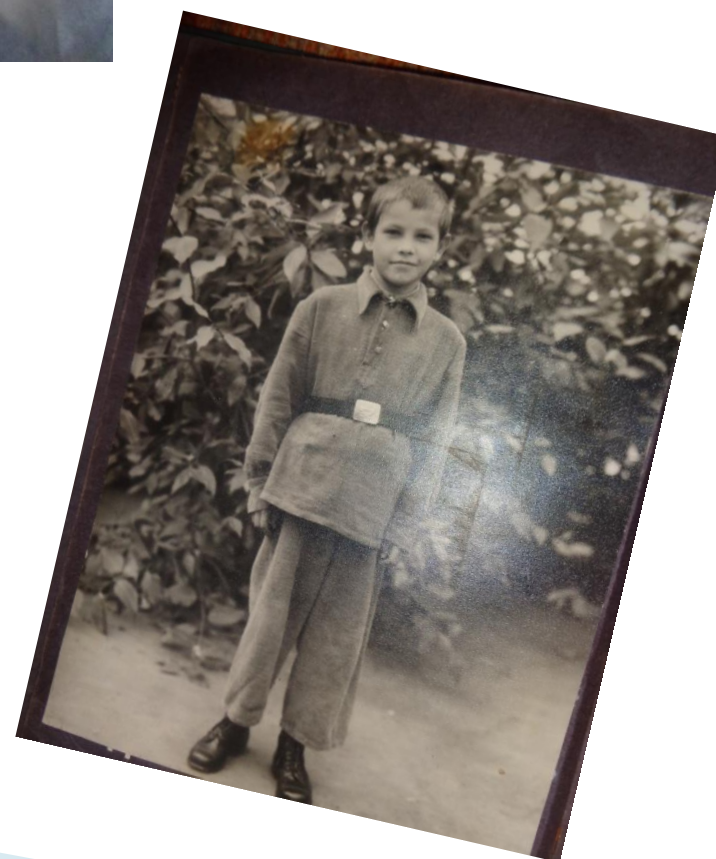
Бабушкин брат в Первом классе.