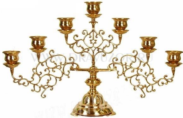
Семисвечник - Менора