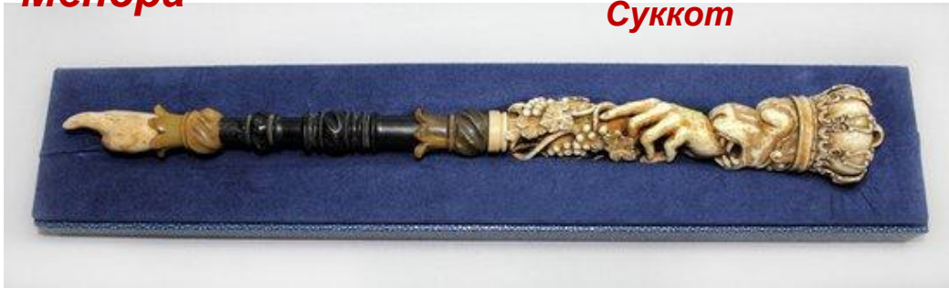
Яд – указка для чтения Торы