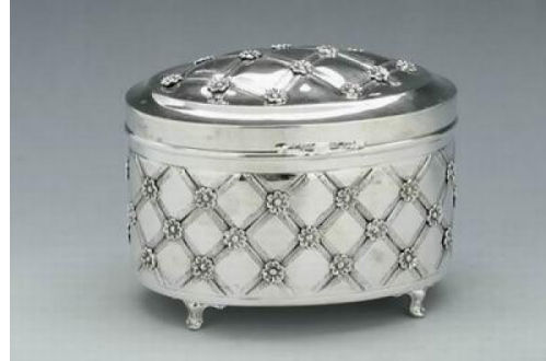
Серебряная коробочка- ларец для хранения лимончика-этрога в период празднования Суккот