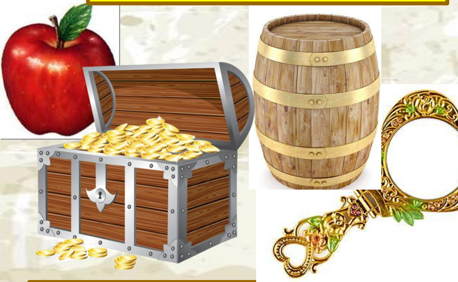
Волшебные предметы из сказок Пушкина