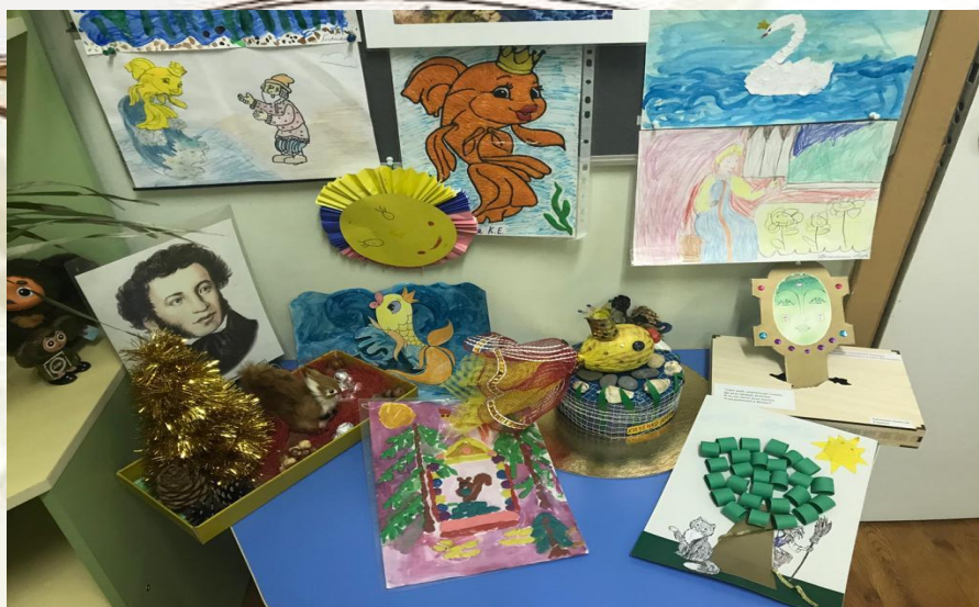
Выставка творческих работ по сказкам Пушкина