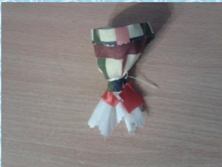
С изнанки делам затягиваем сарафан