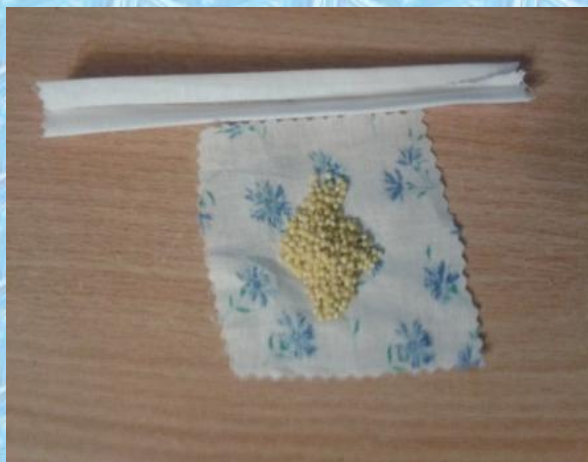
Скручиваем полоску для рук, завязываем котомку, прикрепляем к рукам