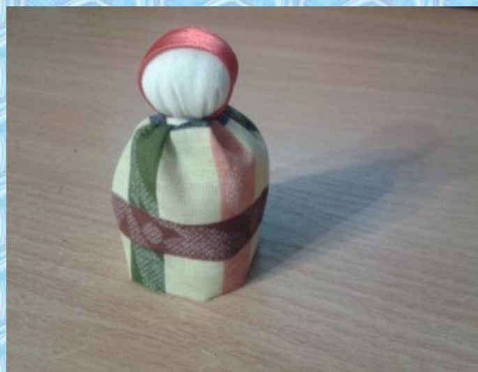
Выворачиваем на левую сторону