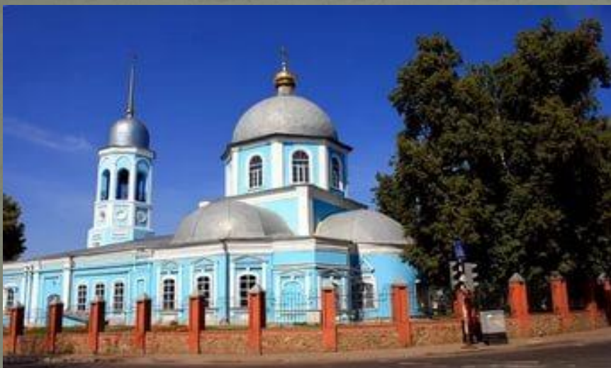
Введенский храм, 1761 г. (ул. Дубровинского)