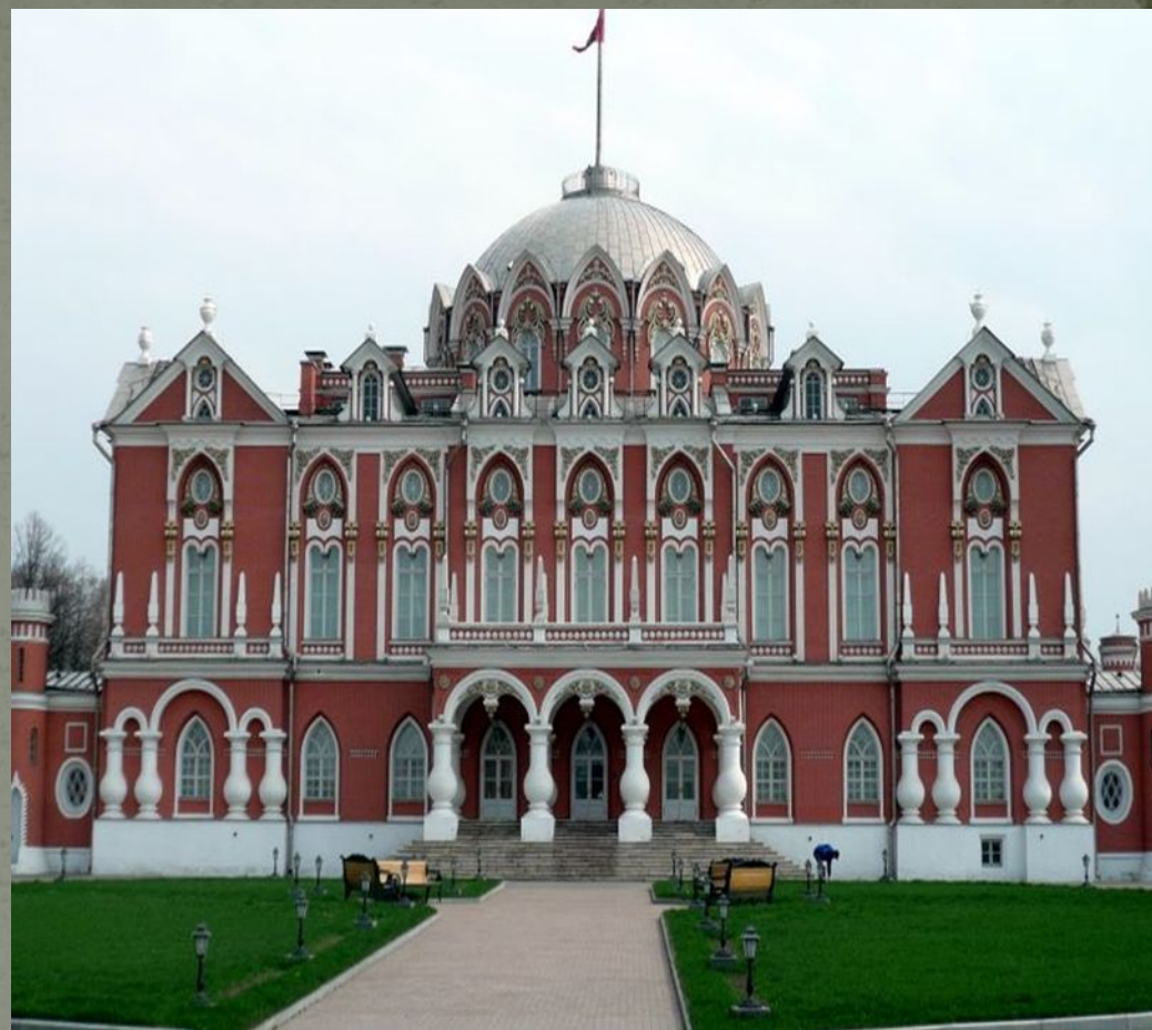
Петровский путевой дворец