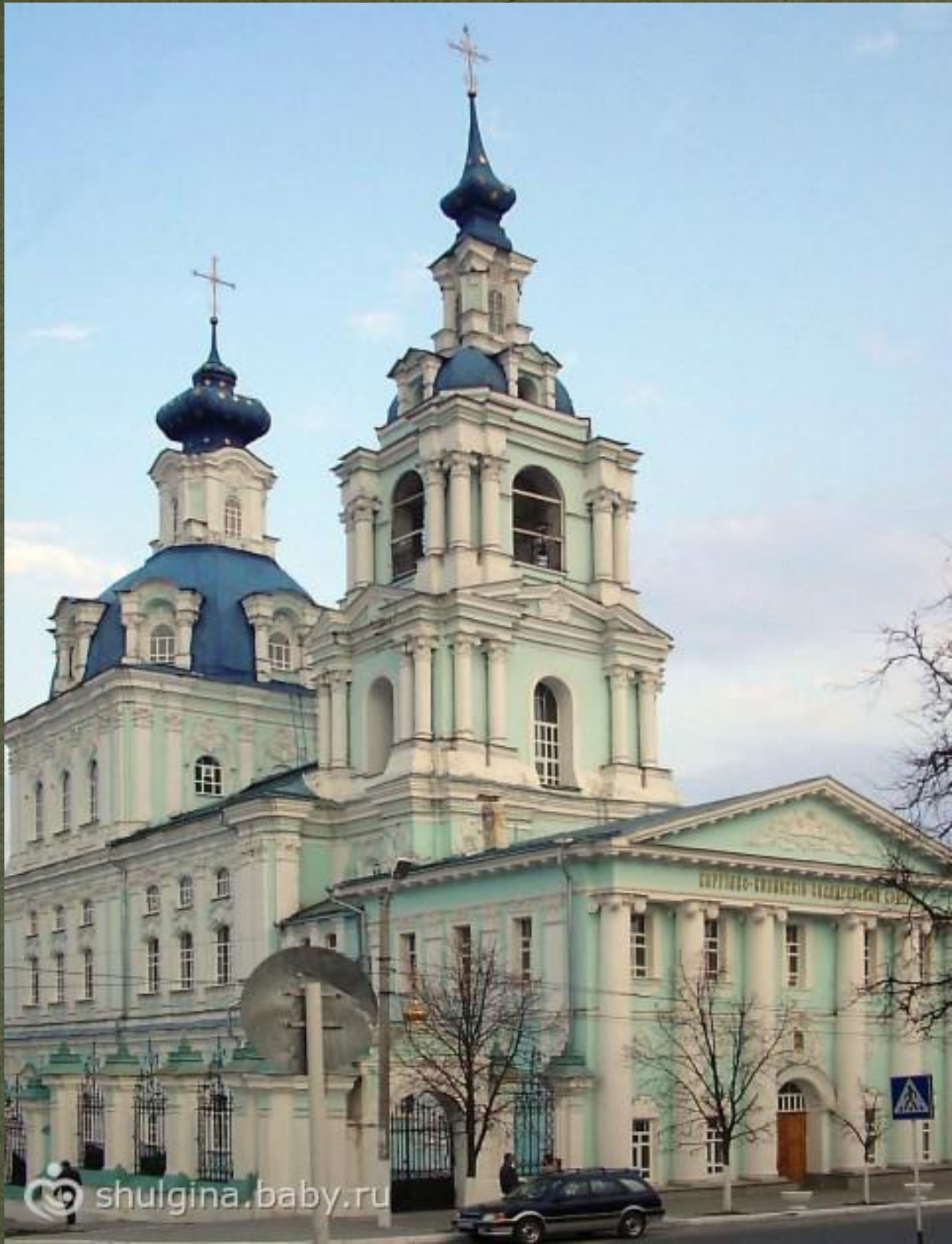
Сергиево- Казанский собор, 1778 Г.