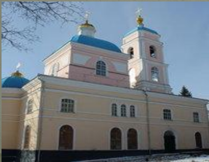
Церковь Иоанна Богослова, 1780 г. (ул. Дзержинского)