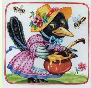
Сорока - белобока

Птица – кашевар из детского стишка (6 букв)