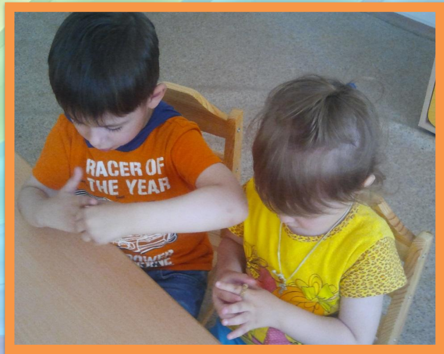
Массажные колечки Су-джок