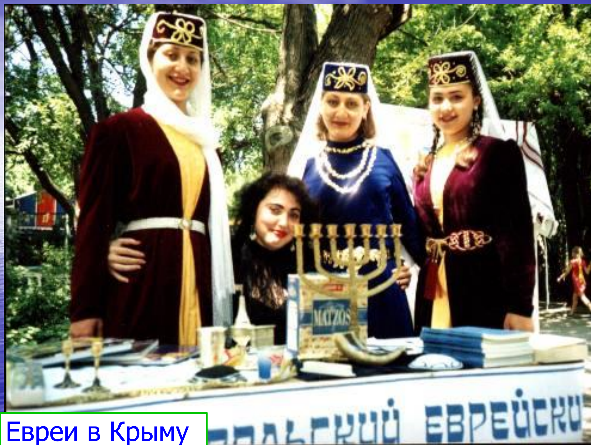
Евреи в Крыму