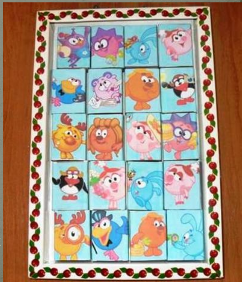
Театр на спичечных коробках