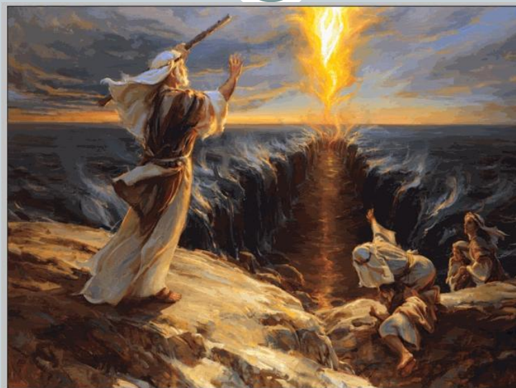
Исход из Египта через море

Скрижа́ли Заве́та или Скрижали свидетельства — две каменные плиты, на которых, согласно Библии, были начертаны Десять заповедей.