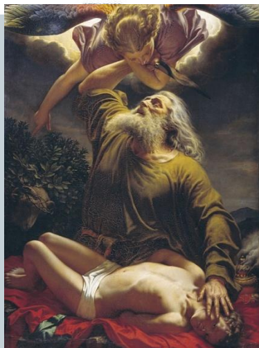
Авраам приносит в жертву Исаака