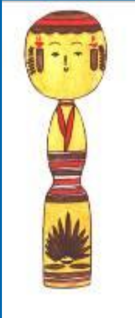
Дедушка матрешки – японский фукуруму