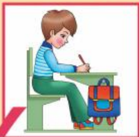
Посадка при письме