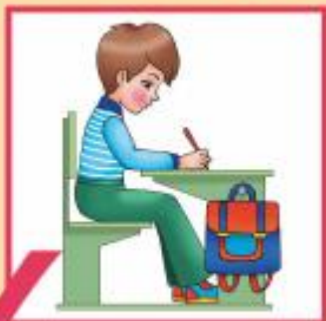
Посадка при письме