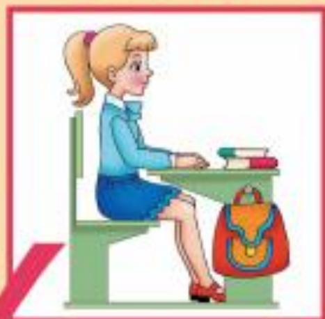
Посадка «готов к работе»