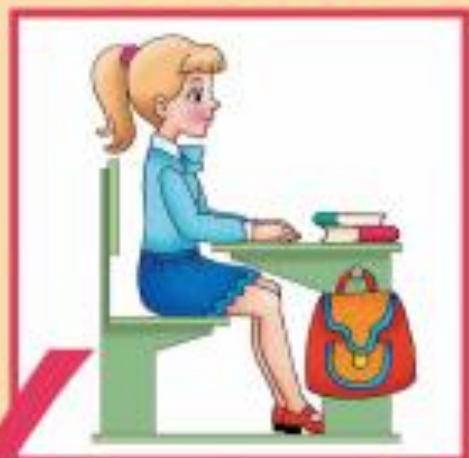
Посадка «готов к работе»