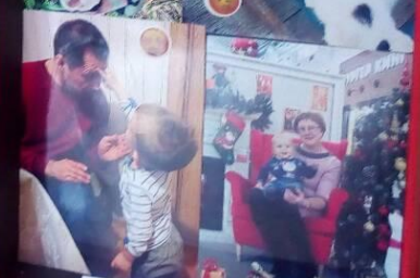
Любимые бабушка и дедушка)