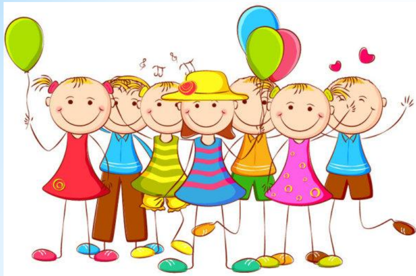
Книжка – передвижка «Хобби»