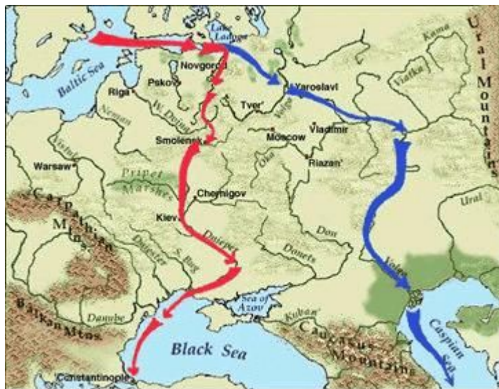
Varangian Trade Routes