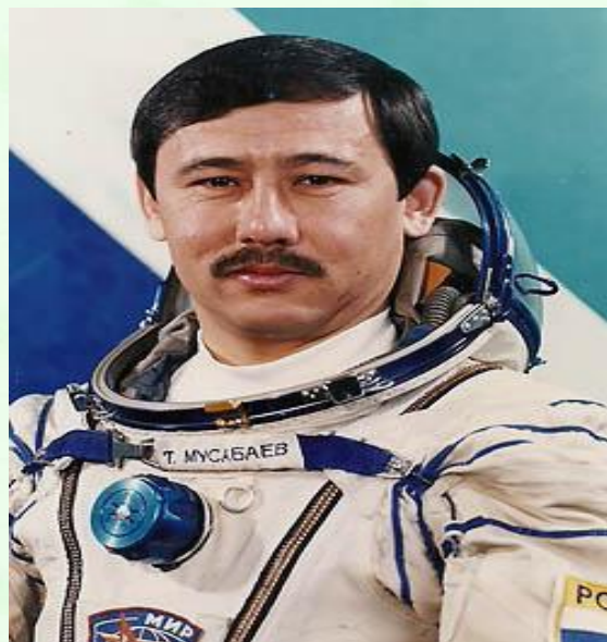
Талғат Мұсбаев 1994 жылдың 1-нші шілде күні ұшты.