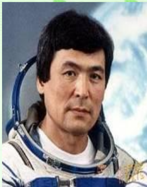
Токтар Әубәкіров қазақтың тұңғыш ғарышкері 1991 жылдың 2-нші қазан күні ұшты.