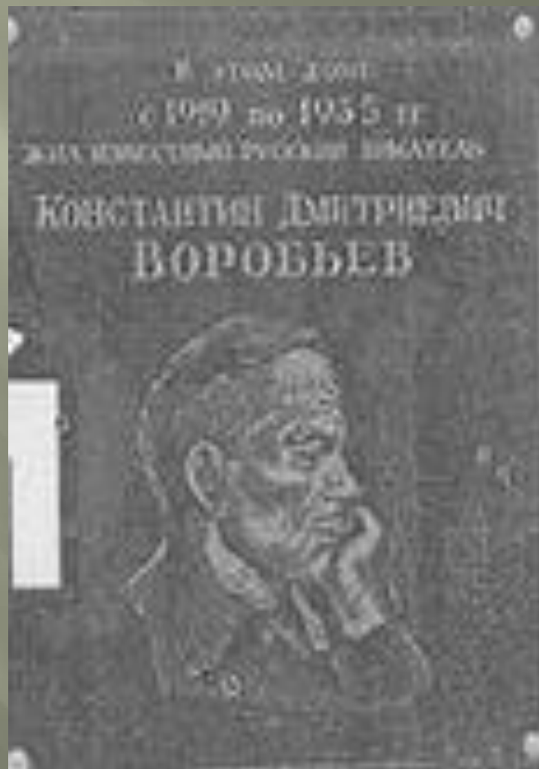
Мемориальная доска на доме К.Д. Воробьёва