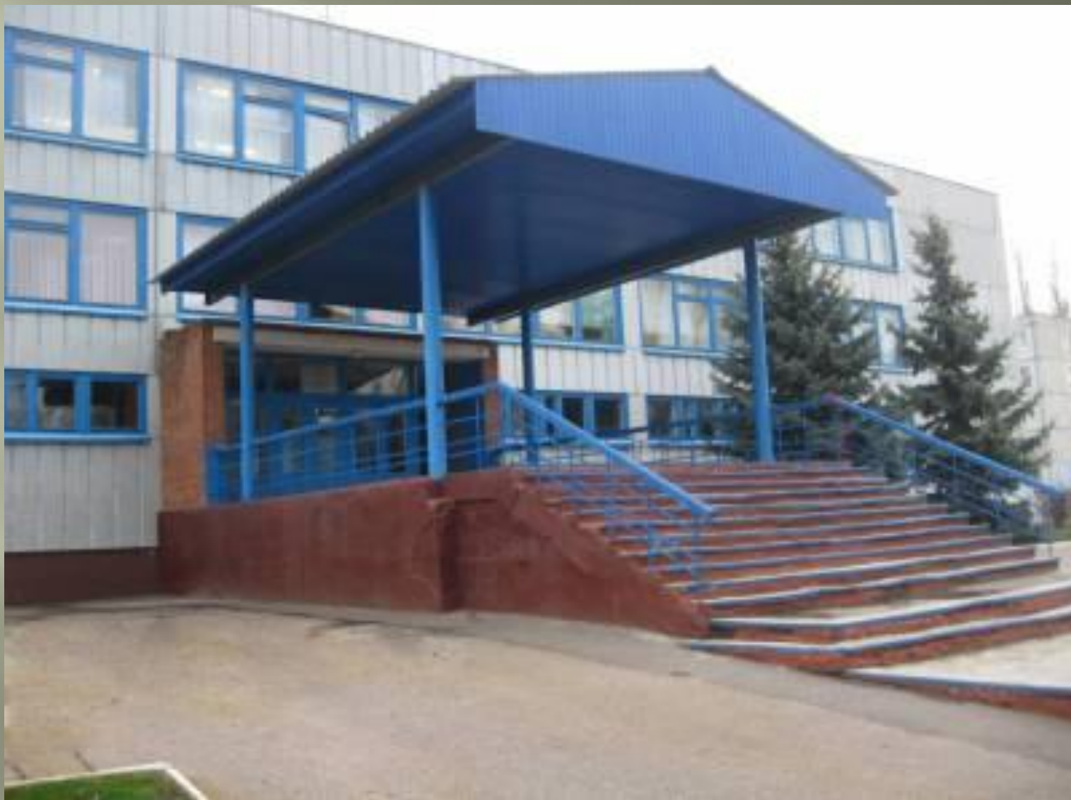
Школа №35 им. К.Д. Воробьёва