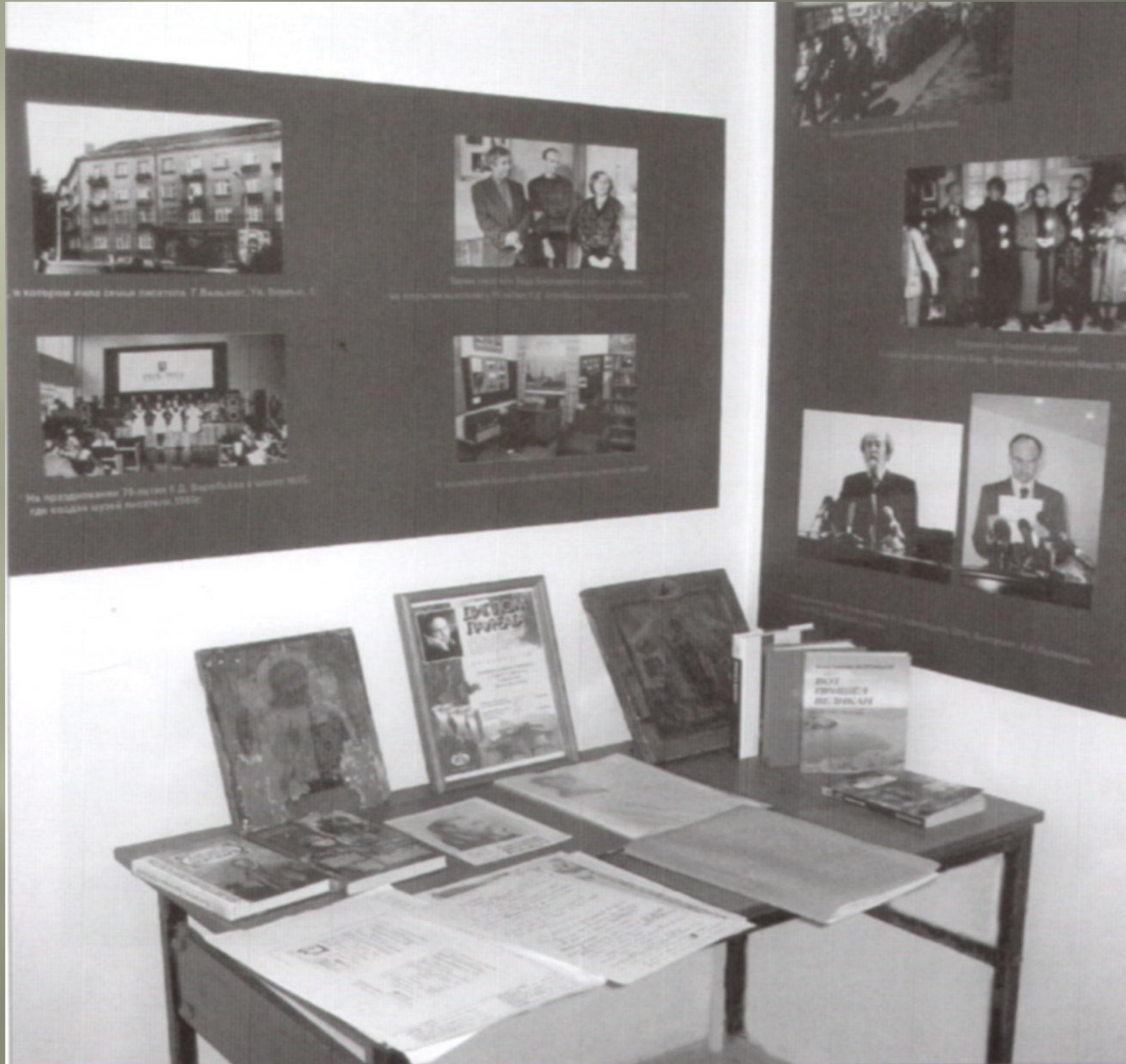
Музей К.Д. Воробьева