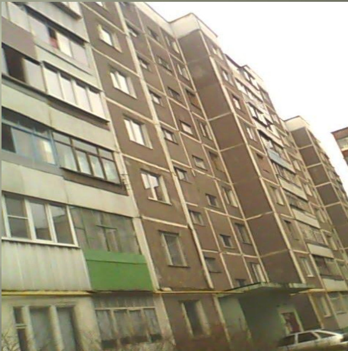
Улица Воробьева в городе Курске