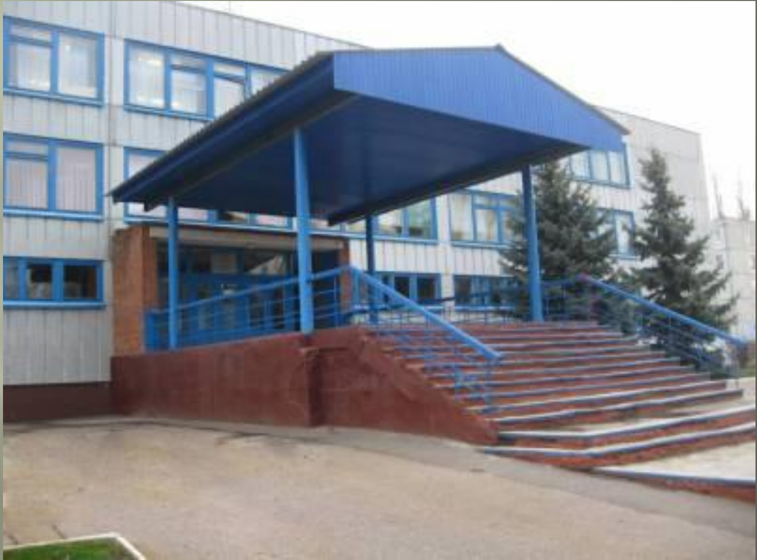
Школа №35 им. К.Д. Воробьёва