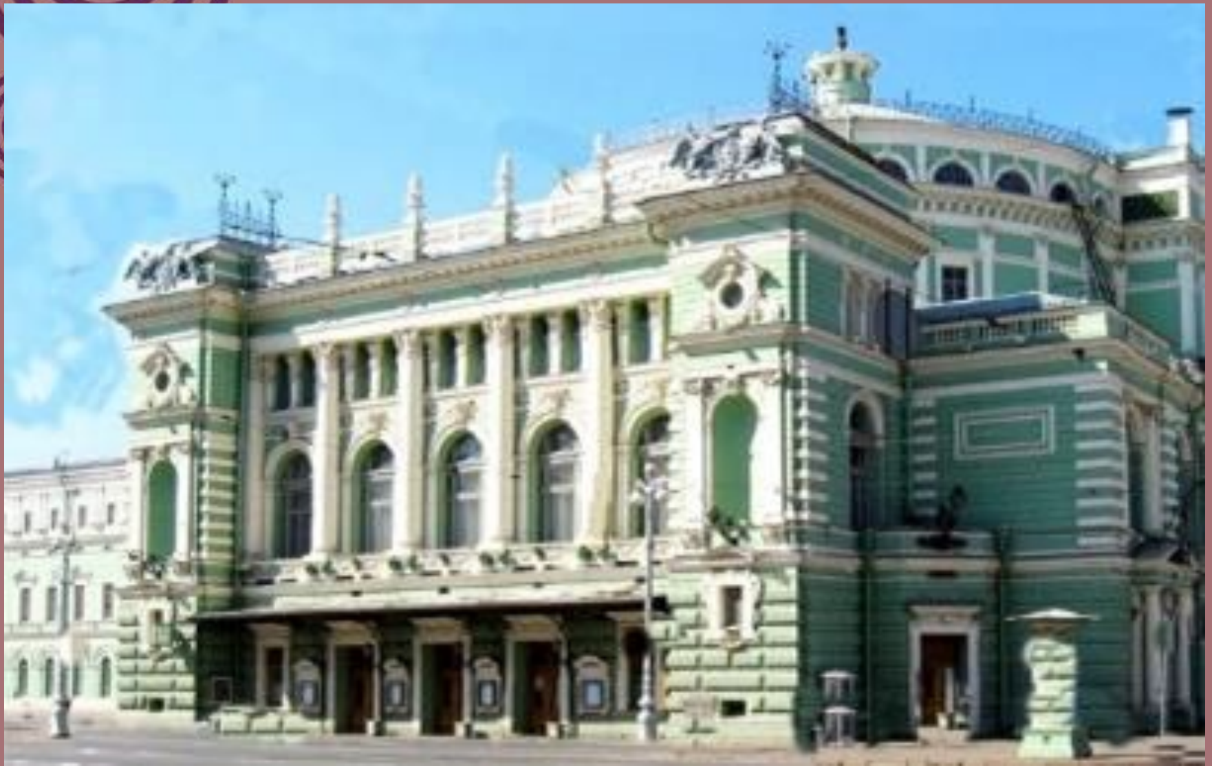
Мариинский театр, Санкт-Петербург