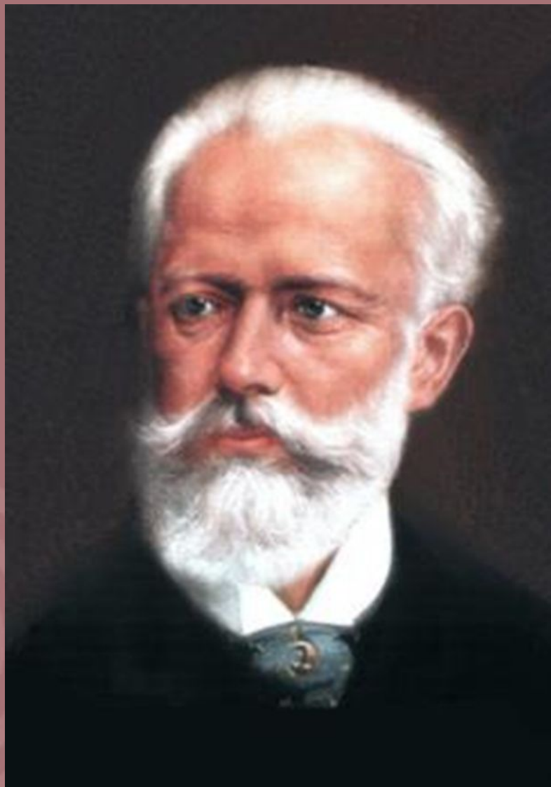
Пётр Ильич Чайковский 1840 — 1893