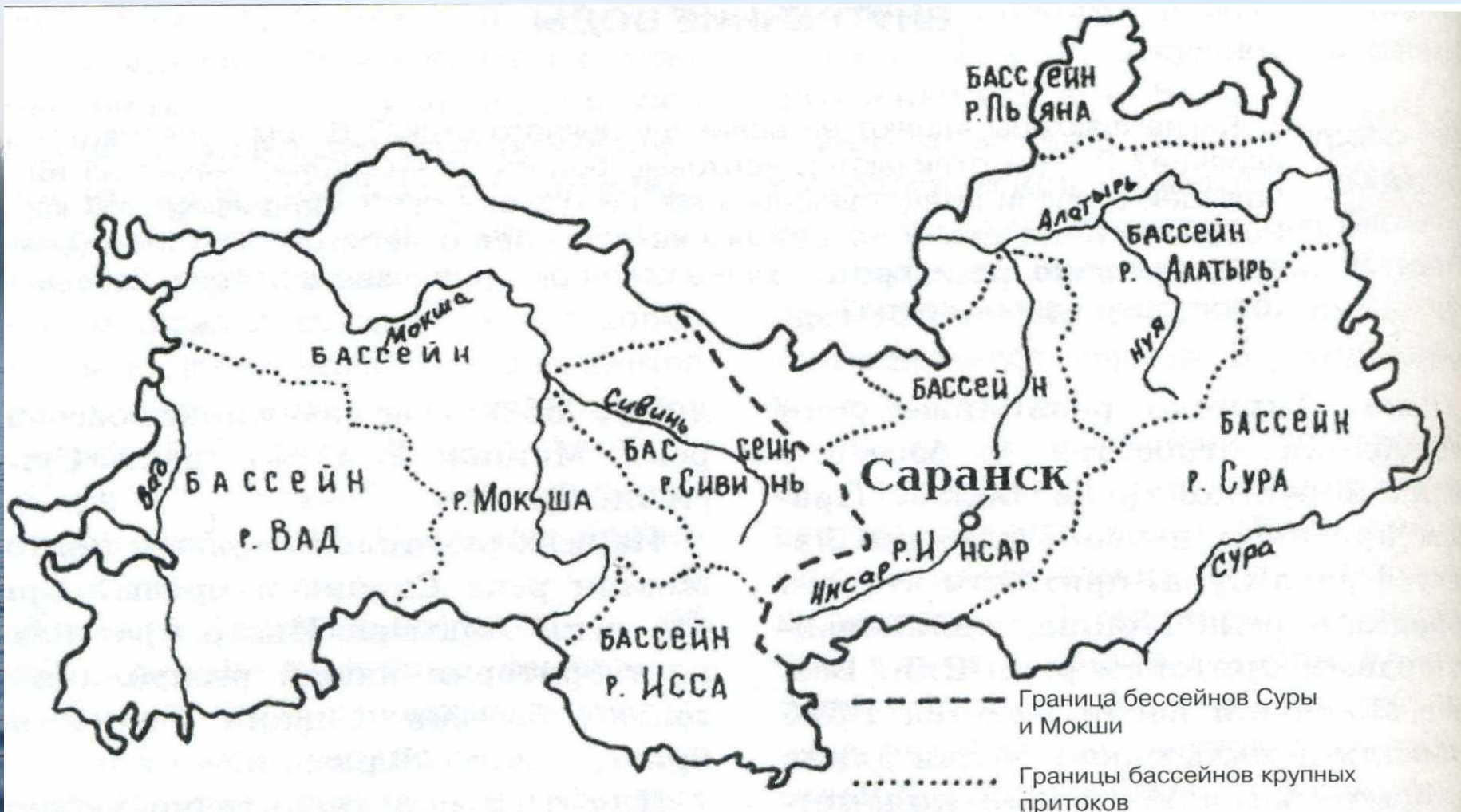
Бассейны крупных рек

Для всех рек республики характерно небольшое падение (30-70 см на 1 км длины) и типично равнинный характер течения. Общее падение территории на север определяет и основное направление течения рек. Исключение составляет река Алатырь, текущая почти строго с запада на восток.