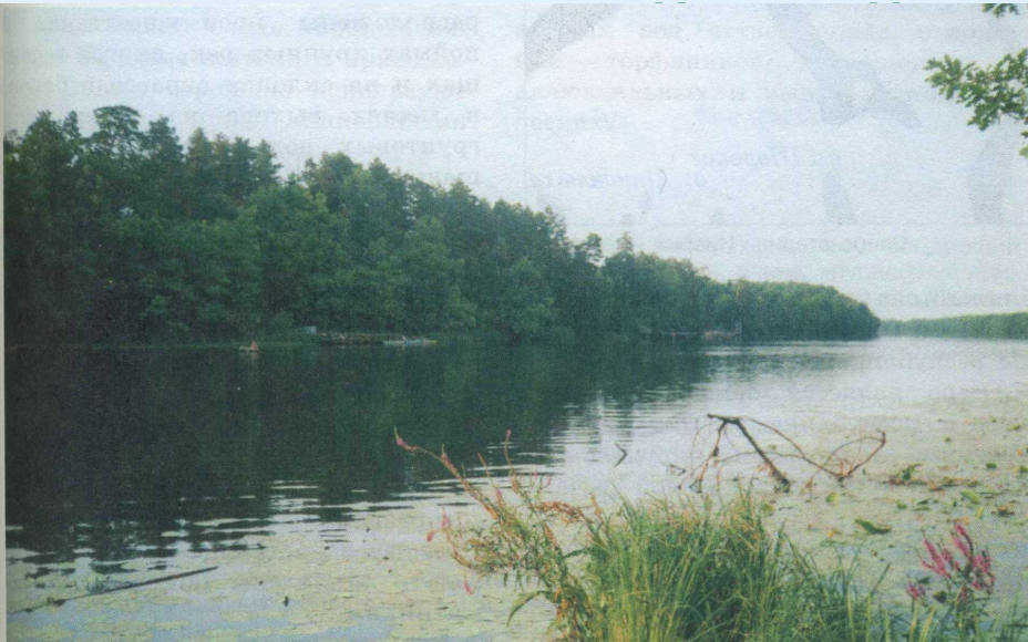
Озеро-старица Инерка (Большеберезниковский район)

По происхождению озера Мордовии преимущественно пойменные озера-старицы и представляют собой отделившиеся от основного русла рукава или протоки, вследствие чего имеют извилистую или подковообразную форму: а, Жегалово и др.