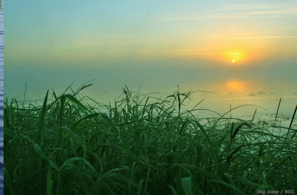
Восход на озере