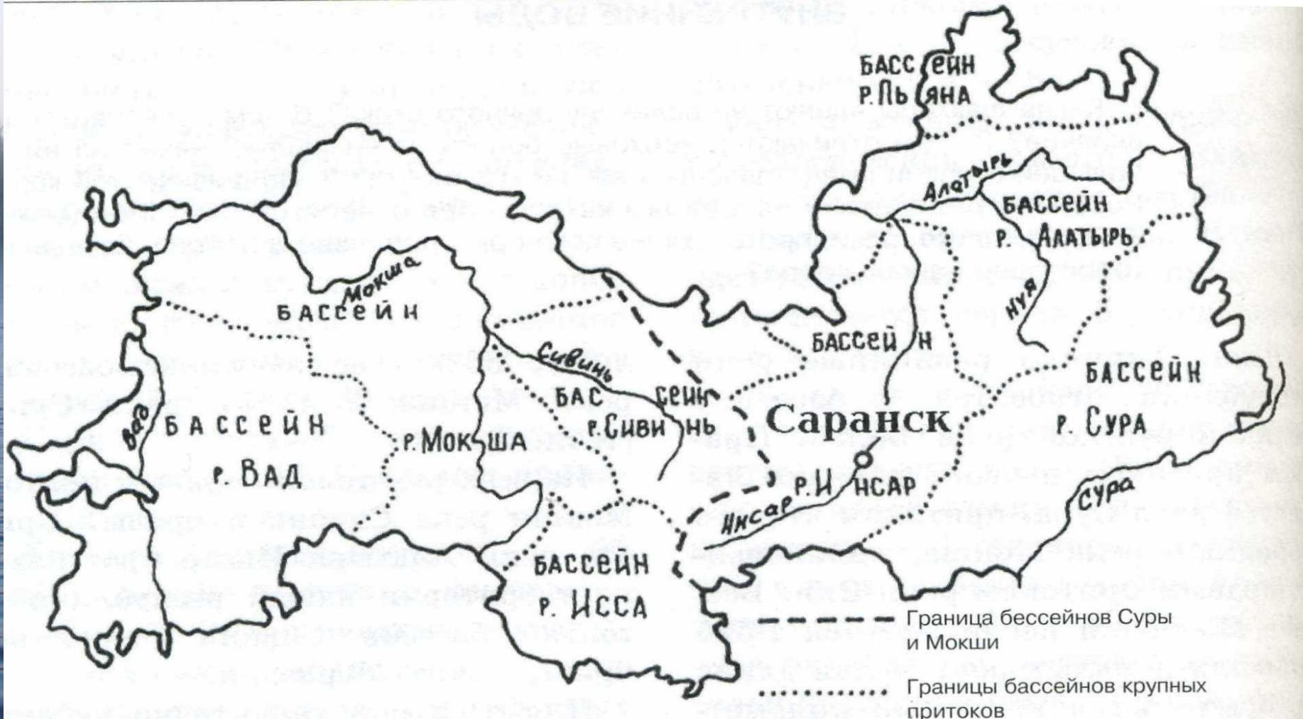
Бассейны крупных рек

Для всех рек республики характерно небольшое падение (30-70 см на 1 км длины) и типично равнинный характер течения. Общее падение территории на север определяет и основное направление течения рек. Исключение составляет река Алатырь, текущая почти строго с запада на восток.