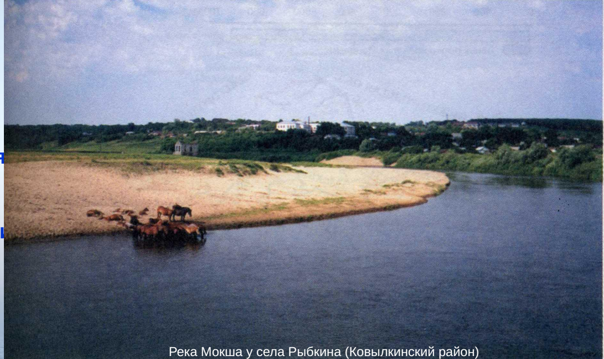
Река Мокша у села Рыбкина (Ковылкинский район)

Предполагают, что название реки возникло от наименования одной из этнических групп мордвы – мокша, которая расселена в западной Мордовии в бассейне этой реки.