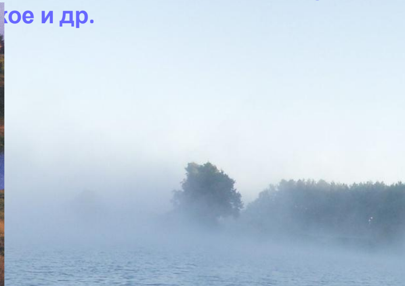
Озеро Ендовище (г. Темников)