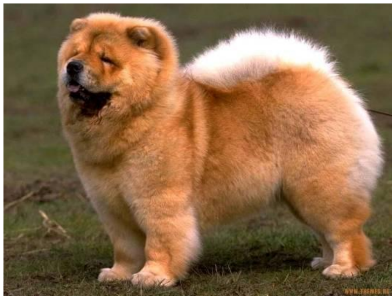
ЧАУ – ЧАУ

Эти собаки живут рядом с нами, не приносят никакой материальной пользы. Но они помогают людям, радуют своей красотой, дружбой и преданностью, а люди с любовью заботятся о них.