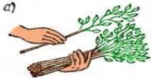
Схема заготовки веников