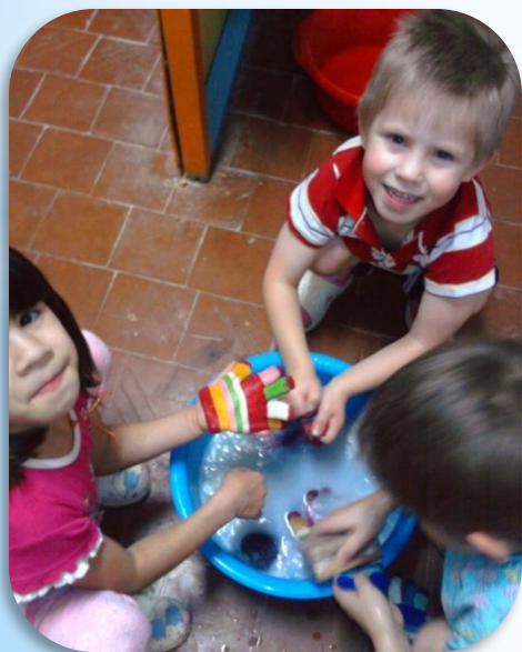
«Постираем свои носочки»