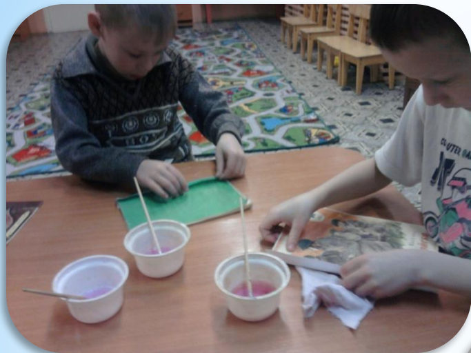
«Стирка кукольного белья»