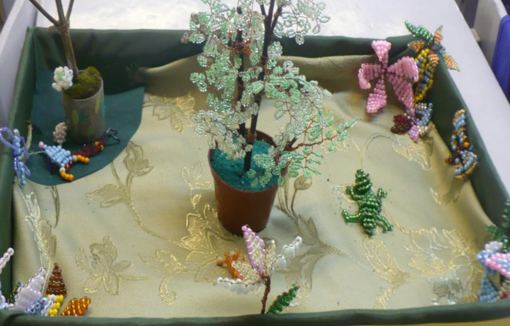
Коллекционная работа учеников 4 «б» класса