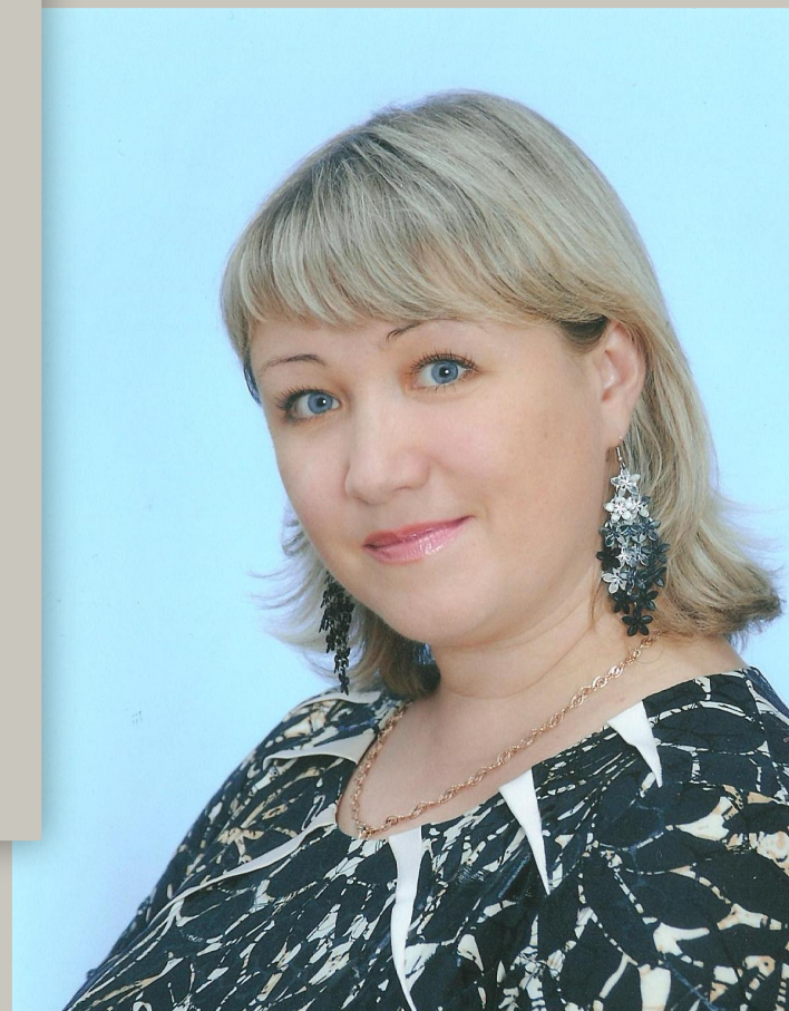
© Чеблуква Наталья Александровна, учитель начальных классов МБОУ «СОШ № 11» г. Асбеста