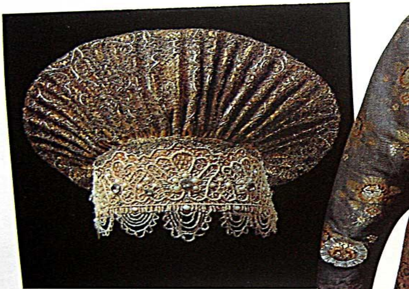
Праздничный женский головной убор — кокошник типа «сборник». Архангельская губерния. Начало XIX в. Исторический музей. Москва.