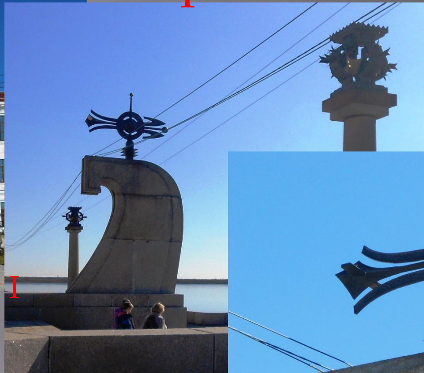
Памятный знак в честь 400летия города