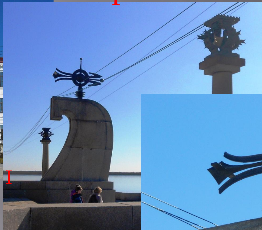
Памятный знак в честь 400летия города