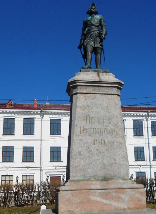
Памятник Петру I