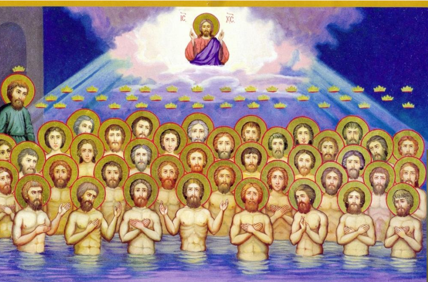
ИМЯ ЛИЧНОСТЕЙ ССВЯТЫХ СЕРДЦА КРОВАВИГО: КИРИЛЛА, КАНДИДА, АОННА, ИСИЯНА, ИРМАНА, СИЛАРА, СКИПИОНА, УЛЕНТА, СТЕФАНА, КИЛЛАНО, ПОНКА, ФЕОДАН, ИРИЛЛА, КЕРАНА, НАНА, СИМОНА, СИЛАН, ФЛАВИА, АКАКИО, ЕВДИАН, АСИМАКА, ВАССИЛАН, ПАПА, ПИРРИНО, АФАНА, АДОНИАН, РАНА, ЛЕОНТИА, МА, КИРИА, САРДЕНА, ПИРРА, УЛАРИА, АМОКТИМОНА, СЕРГАН, ХЕРОНО, АЛЕКСАНДРО И АГАПА (и др.).