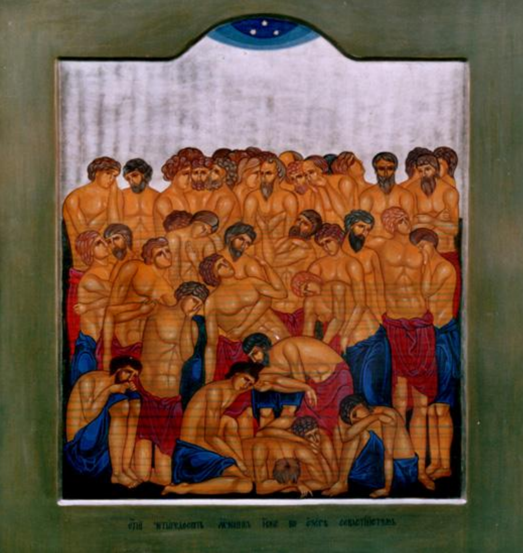
СТО ИМЕНА ССВЯТЫХ СЕРДЦА КРОВАВИГО