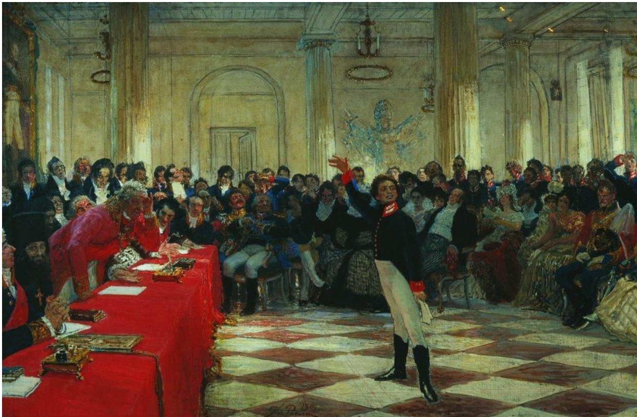
А.С.Пушкин на выпускном экзамене

После окончания лицея, Пушкин поступает на государственную службу в Санкт-Петербурге.