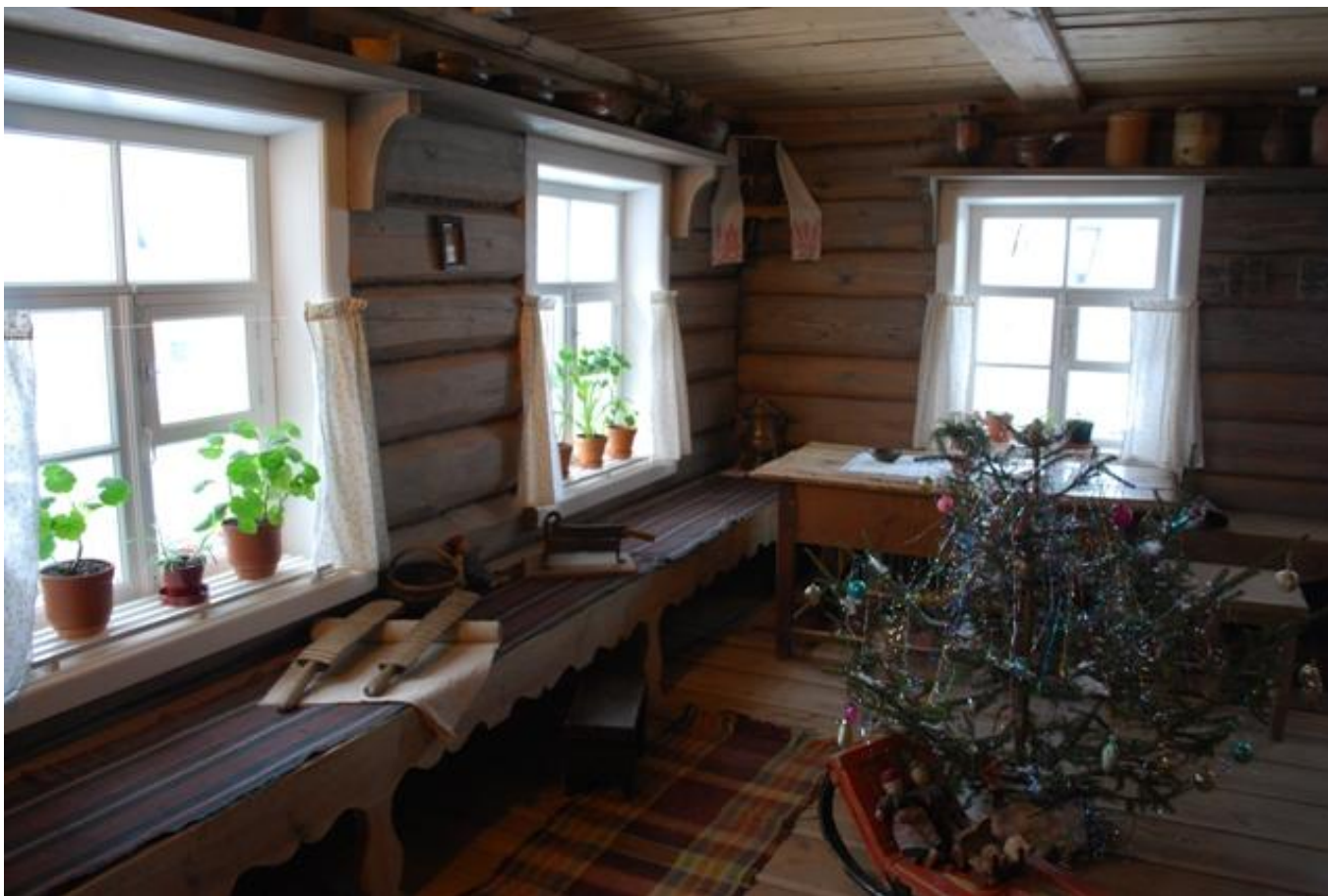
Внутреннее убранство няниного домика