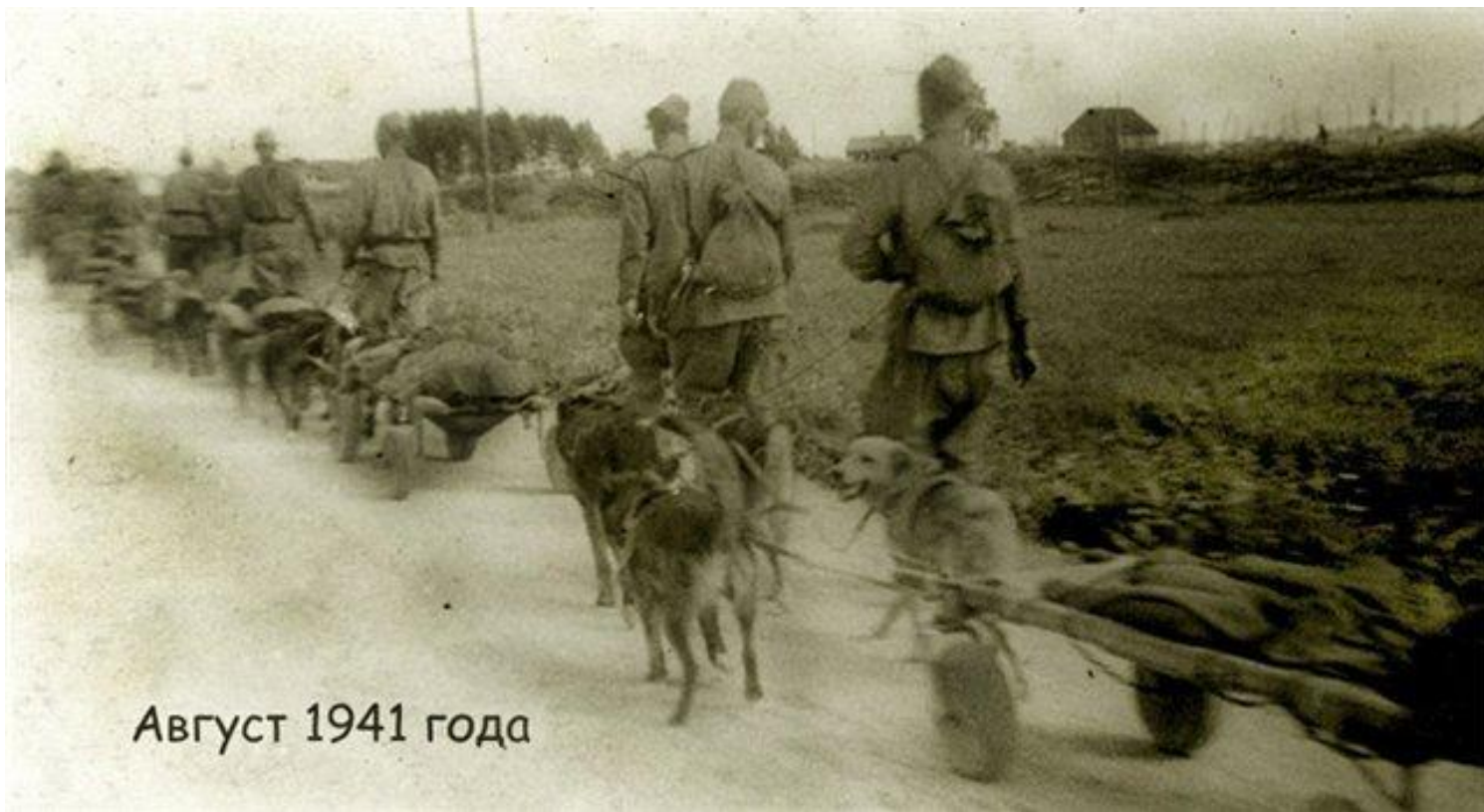
Август 1941 года

Около 15 тысяч упряжек, зимой на нартах, летом на специальных тележках. Под огнем и взрывами вывозили с поля боя около 700 тысяч тяжело раненых, доставили на передовую по 20-30 тонн груза – боеприпасов, продуктов питания, медикаментов.