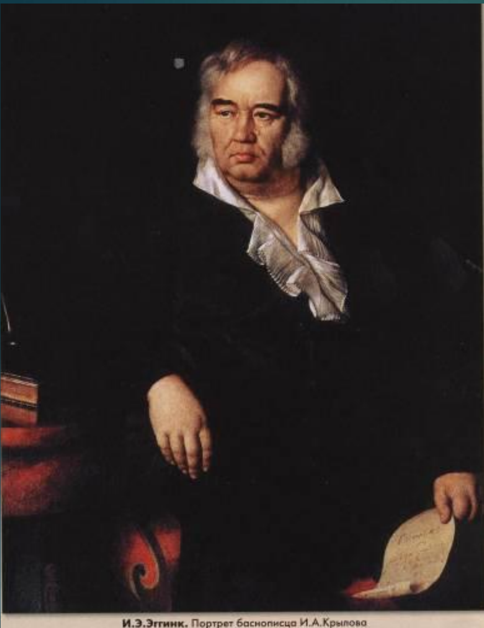
И.Э.Эггинк. Портрет баснописца И.А.Крылова