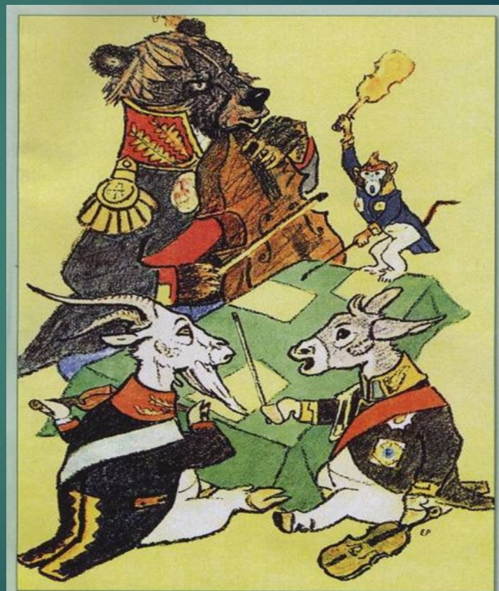
Е.Рачев. Иллюстрация к басне «Квартет»

«А вы, друзья, как ни садитесь, Всё в музыканты не годитесь».