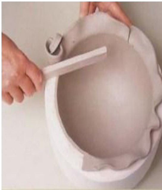
Отминка в готовую форму