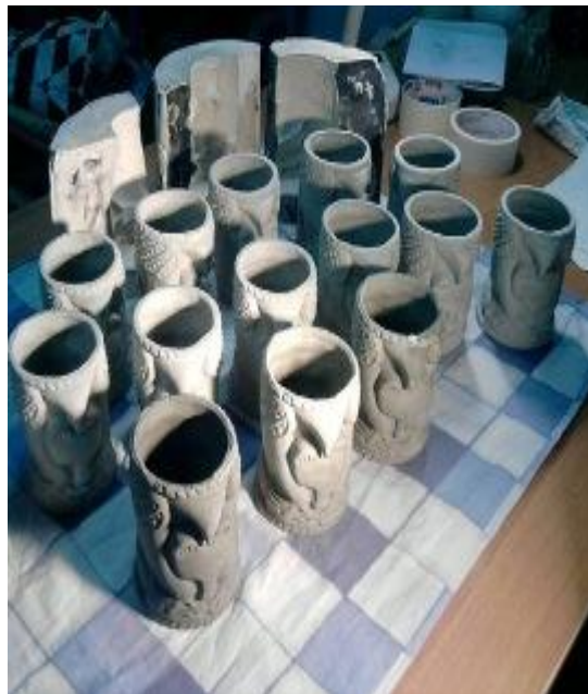
Отливка в гипсовую форму