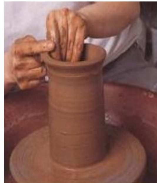
Вытягивание изделий на гончарном круге